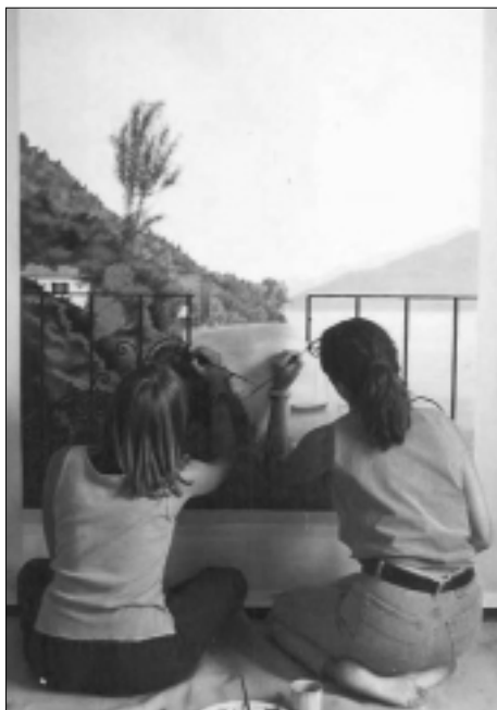
Alcuni esempi della tecnica del "Trompe l'oeil" [espressione francese che significa letteralmente: "ingannal'occhio"]. L'effetto è tridimensionale, la superficie su cui è realizzato il decoro è piana. Con questa tecnica si ottengono effetti scenografici di grande interesse all'interno di abitazioni, su pareti, colonne, mobili, facciate di palazzi. Nella fotografia più grande un'artista al lavoro mentre realizza su una parete la veduta di un lago.

"Il festival avrà una durata di tre giorni, dal venerdì alla domenica, il 30 e 31 maggio e l'1 giugno ed avrà come fulcro l'esposizione di trompe l'oeil, dipinti su tela o con riproduzione fotografica in grande formato di opere murali. Alla rassegna saranno affiancati un concorso a tema che coinvolgerà gli artigiani-artisti, una serie di eventi collaterali ed una mostra-mercato di tutto ciò che riguarda il settore del decoro e dell'arredo casa. Invitiamo dunque a contattarci decoratori, aziende specializzate nei complementi d'arredo, pittori, operatori specializzati nelle vetrine artistiche, negozi di belle arti, architetti specializzati nell'arredocasa, editori di riviste specializzate. Questi ultimi, così come gli architetti,