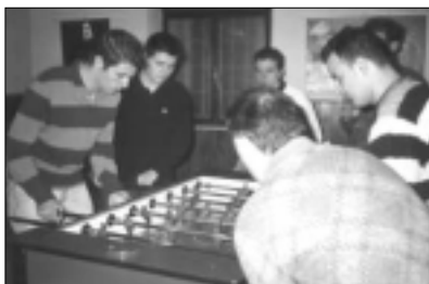
Giocatori in azione durante la precedente edizione.